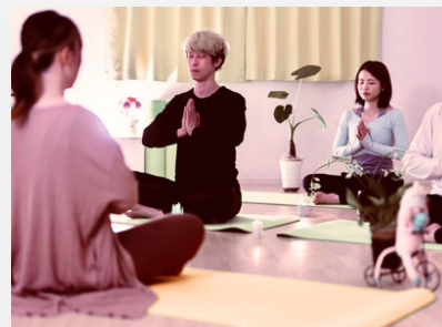
キャンドル瞑想 / メンタルケアカウンセリング